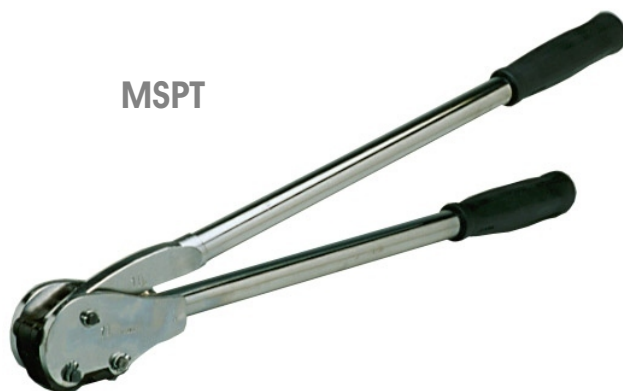
Selador para fita de Poliéster